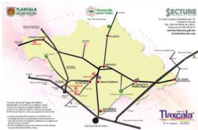
Ilustración 3. Mapa de localidades con vocación turística en Tlaxcala.

c) Se presenta la ubicación territorial de la población que presenta el problema, ya que se señalan los municipios que forman parte de la oferta turística del Estado de Tlaxcala. Según el Sistema de Información Turística Estatal de la SETYDE, las localidades con vocación turística son: Tlaxcala, Huamantla, Apizaco, Chiautempan, Calpulalpan, Nanacamilpa, Santa Cruz, Tlaxco, Totolac y Zacatelco.