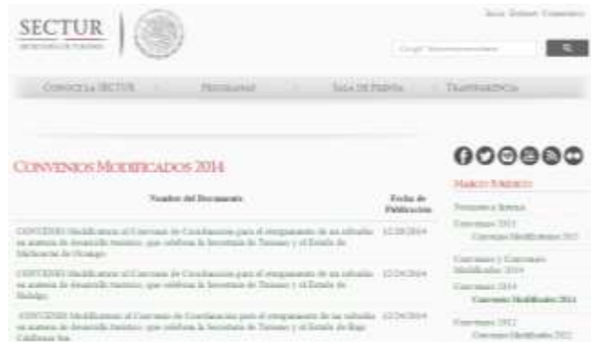
Ilustración 5. Acuerdos de la Secretaría de Turismo 2014

Fuente: Secretaría de Turismo. Véase el sitio web: http://www.sectur.gob.mx/gobmx/proderetus/