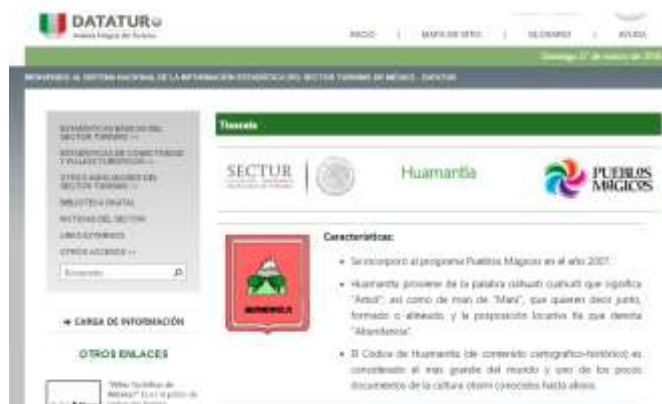
Ilustración 2. Huamantla Pueblo Mágico